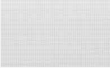
blanco white 300 12363916