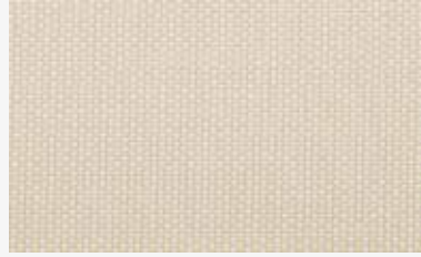
blanco/lino white / linen 300 12363991