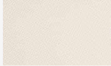
marfil ivory 250-1% 12291103