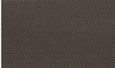
bronce bronze 250-1% 12291125