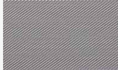
gris gray 250-1% 12291867