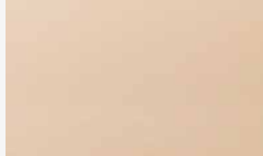
marfil ivory 280 12217938